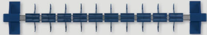
Držač nakita Materijal: plastika