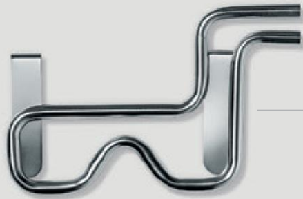
Rashladna zmija Materijal: nehrđajući čelik

Elma tehnologija je mnogo više od uređaja za čišćenje. Seriju Easy možete proširiti našim dodacima – jednostavnim i praktičnim.